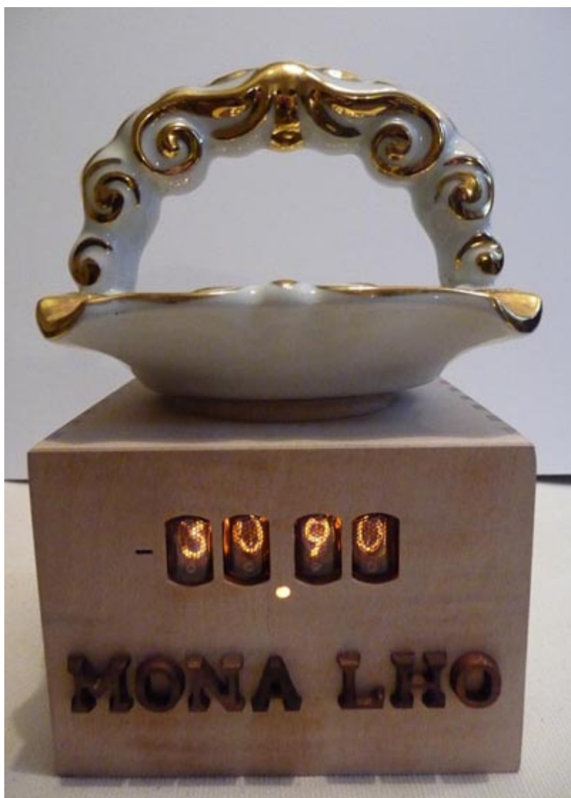
Vue des Nixie Tubes