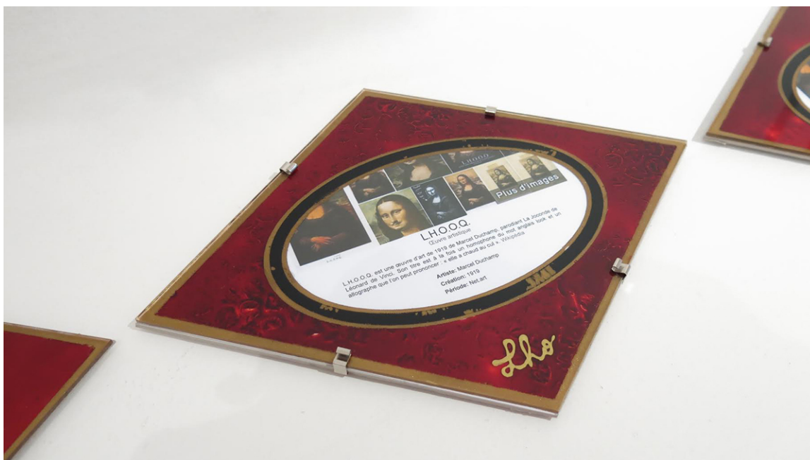
Le cadre des Dessous de L.H.O.