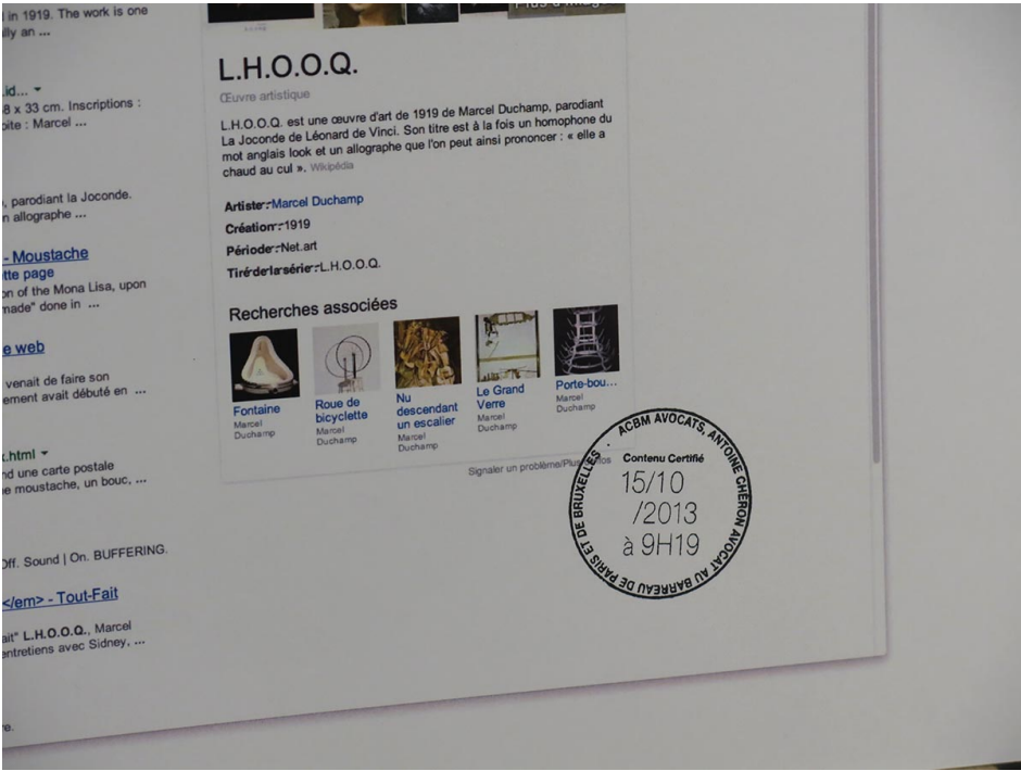
Le détail Tampon Avocats