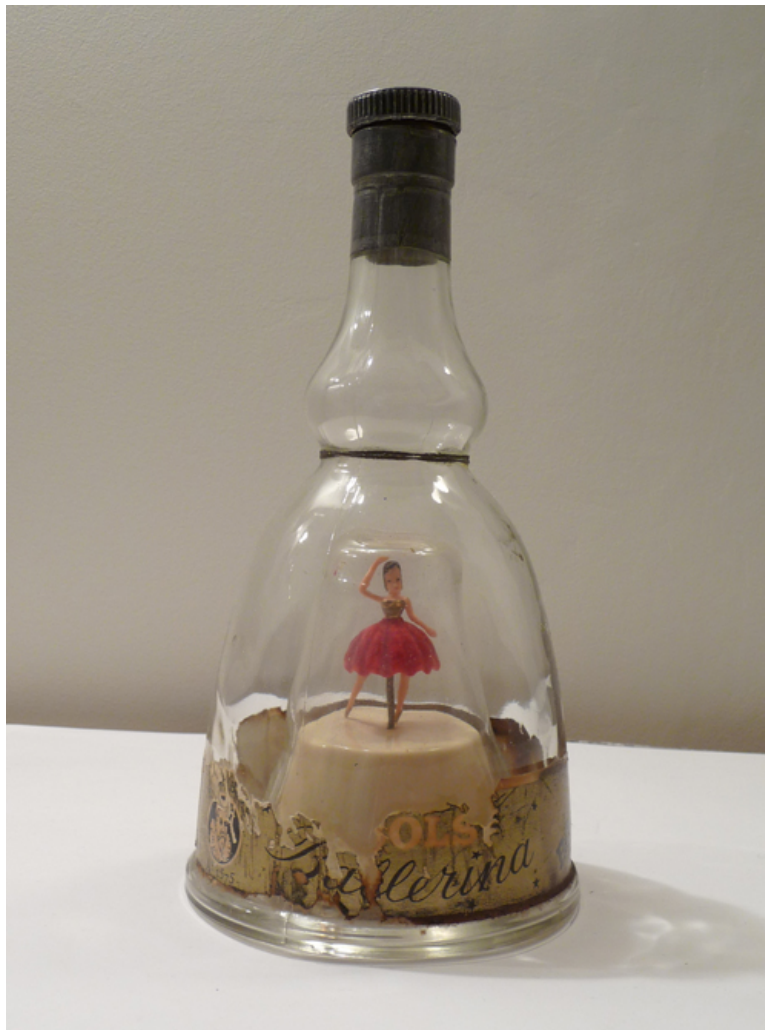
Danseuse interprète "ange"