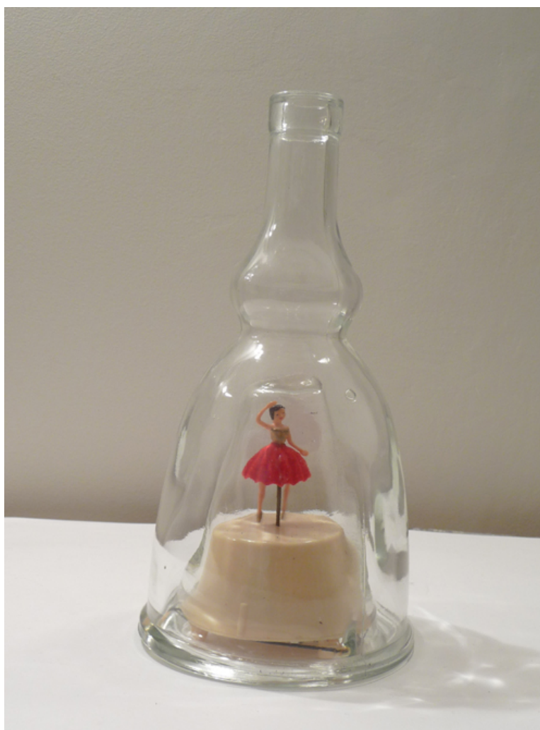
Danseuse interprète "ombre"