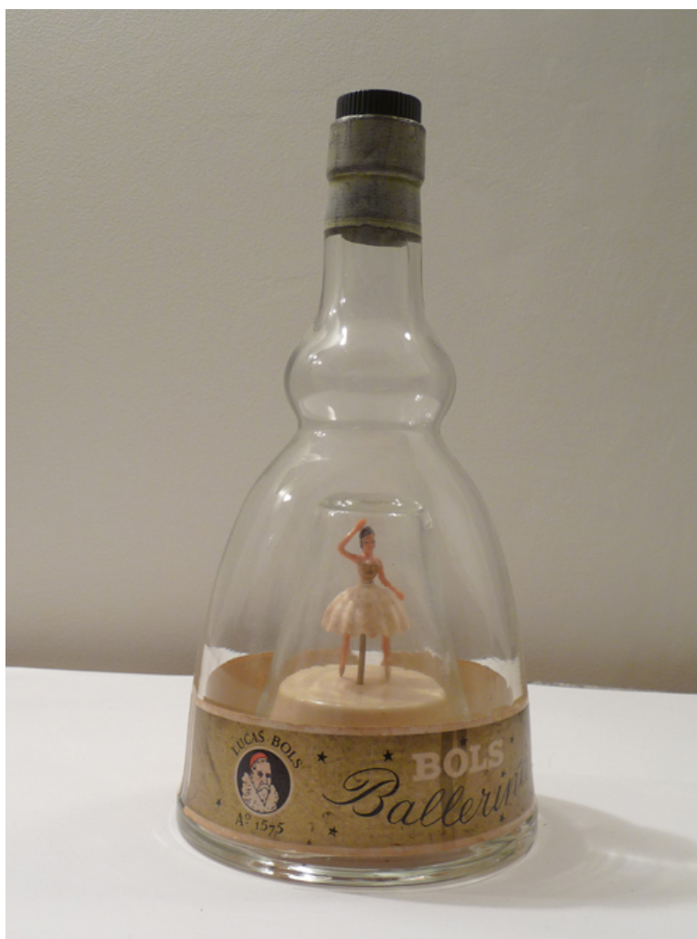
Danseuse interprète "grâce"