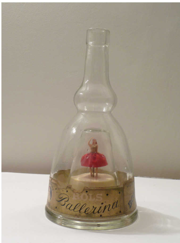
Danseuse interprète "gabriel"