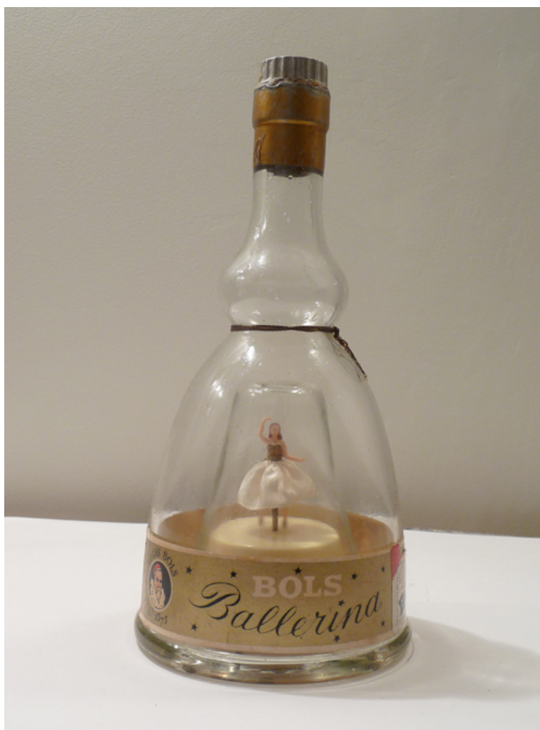
Danseuse interprète "dieu"