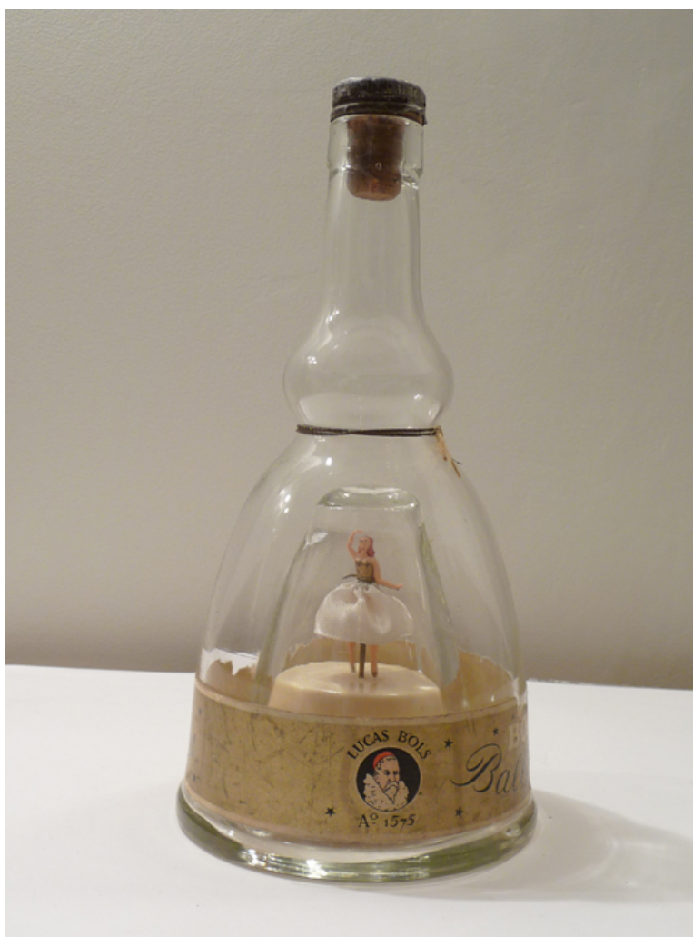
Danseuse interprète "fils"