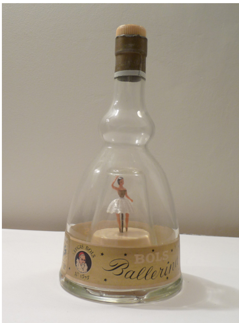
Danseuse interprète "vierge"