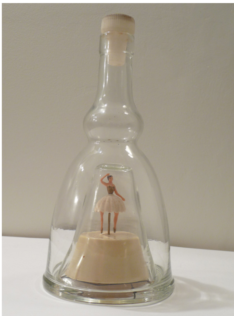
Danseuse interprète "nazareth"