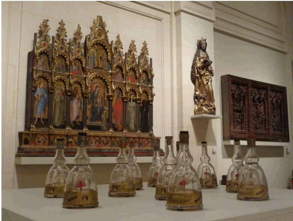
Exposition Musée des Arts décoratifs dans la salle Renaissance