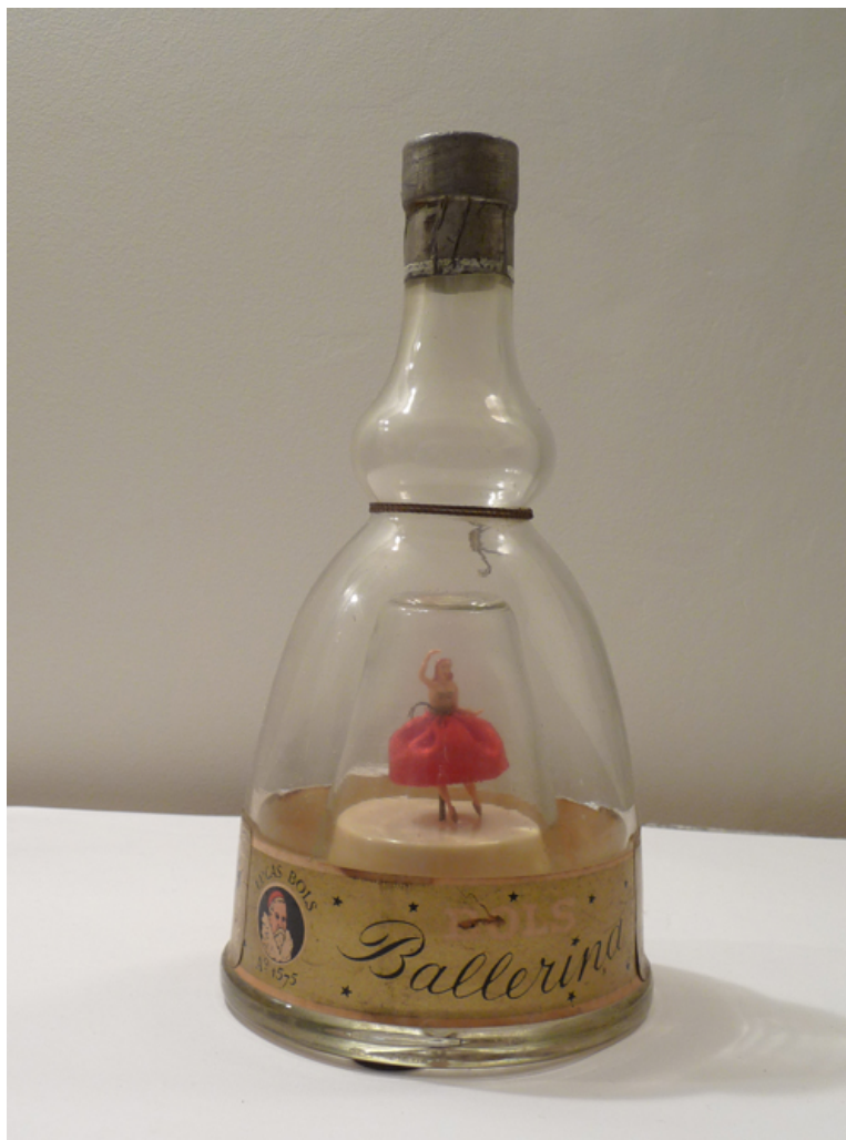
Danseuse interprète "éternellement"