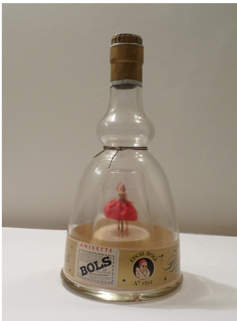
Danseuse interprète "saint esprit"