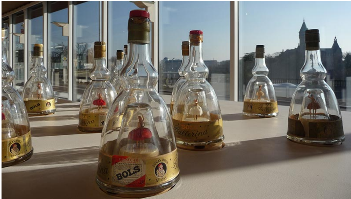
A petits pas vers l'Annonciation