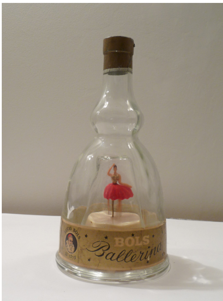
Danseuse interprète "impossible"